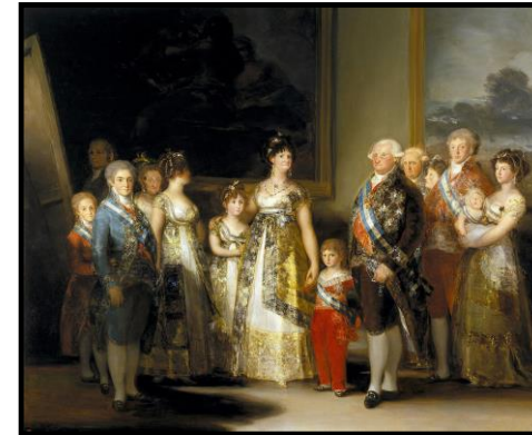
La familia de Carlos IV

4.1.- Clasificación de la obra: Título del cuadro. Autor. Estilo. Cronología aproximada. 0,50 puntos