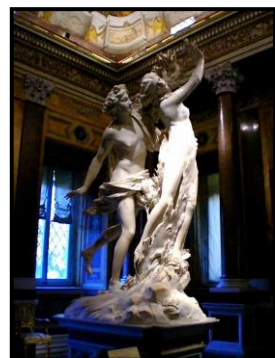
Apolo y Dafne

3.1.- Clasificación de la obra: Denominación de esta escultura. Autor. Estilo. Cronología aproximada. 0,50 puntos