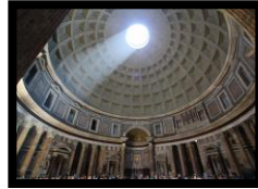
Panteón de Agripa