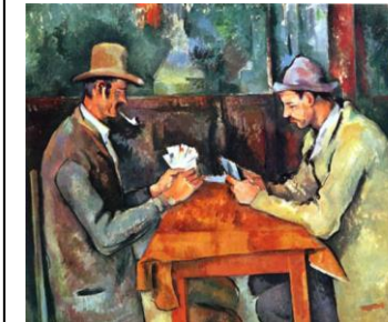
Los jugadores de cartas, Cézanne

4.1. Clasificación: Título. Autor. Cronología aproximada. 0,50 puntos