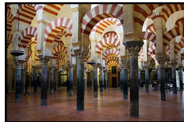
Mezquita de Córdoba

Analogías: edificios adintelados, emplea la columna como elemento sustentante, órdenes arquitectónicos, cubierta a dos aguas, plantas longitudinales-simetría bilateral, plantas centrales-simetría central, casa de la divinidad. Diferencias: crepidoma – pódiom / perístasis – pseudoperíptasis / organización del espacio en función de las divinidades / planta rectangular – planta cuadrangular (templos primitivos romanos).