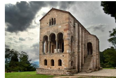
Santa María de Naranco