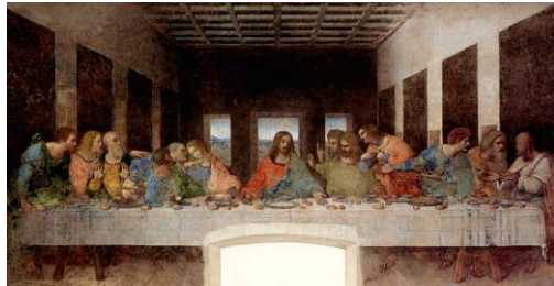
La Última Cena