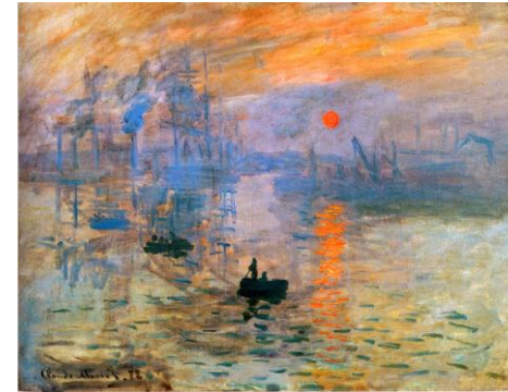
Impresión, sol naciente