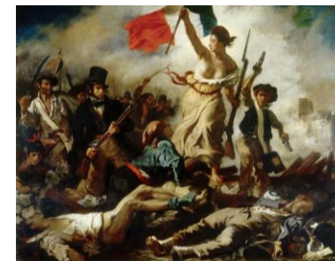
La Libertad guiando al pueblo