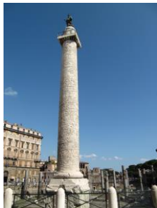
Columna de Trajano